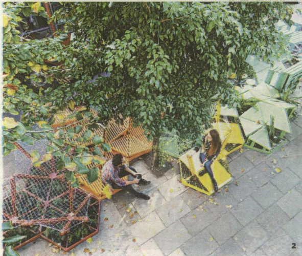
GENTILEZA ALEJANDRO BORRACHIA