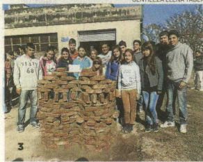
GENTILEZA ELENA TABER