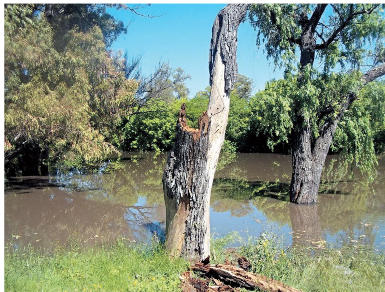
EL RÍO MATANZA DESBORDADO. DE SER DECLARADO RESERVA NATURAL EL BOSQUE SERÁ CUIDADO POR GUARDAPARQUES.

En 2010 el proyecto fue presentado en el Concejo Deliberante.