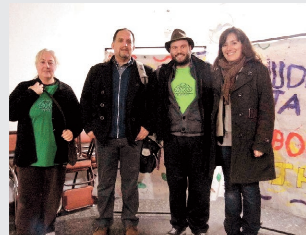
El profesor Quintana señaló la importancia de los humedales.

tener una gran ventaja con respecto a otros países que no la tienen ni la cuidan". También explicó que muchas de las inundaciones que se producen en nuestro distrito y en otros son como consecuencia de la ausencia de espacios verdes. "Las localidades se inundan porque cada vez hay más cemento y menos humedales. Por más que hagan bien las obras de desagües, no es suficiente. Hacen falta más espacios verdes para que la tierra absorba el agua y permanezca más tiempo en el sistema", indicó. Otra razón por la que se hace imperioso proteger los bosques es para evitar que "el agua se vaya rápido al mar porque potabilizar agua salada es muy costoso. Las cañerías y los desagües son autopistas al mar. Lo que retarda el proceso que empieza en los glaciares de la cordillera hasta llegar al Río de la Plata y después al mar son los bosques y los pastizales. Por esos hay que proteger los ecosistemas nativos".