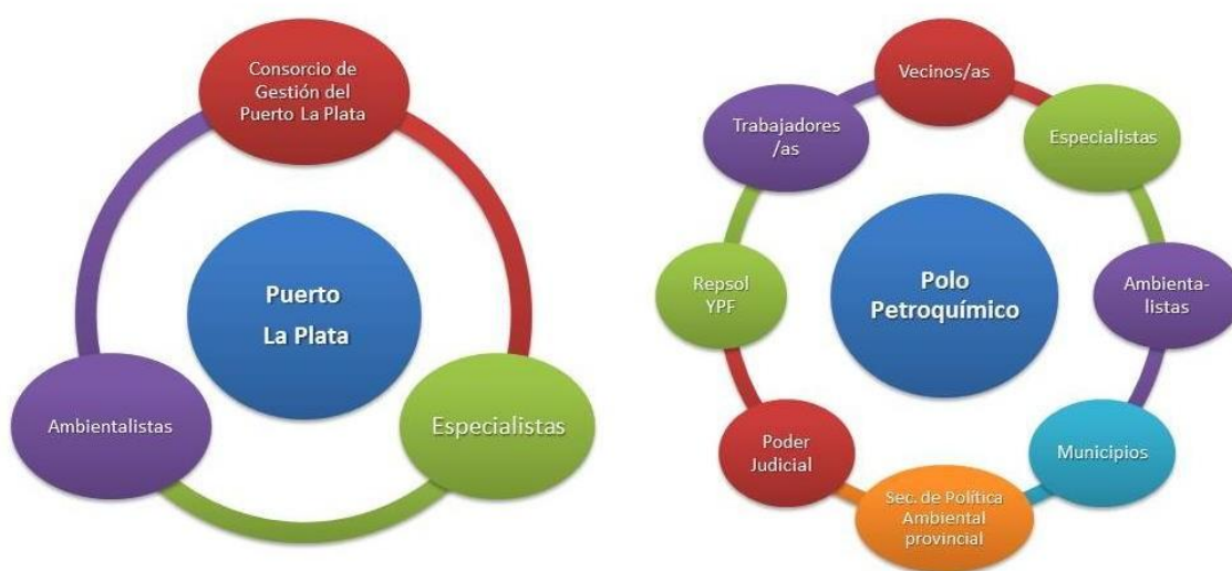
Cuadro 3 – Mapa de actores

En los artículos sobre el caso del Polo Petroquímico , nos encontramos con una diversidad mayor de actores: aparecen los/las vecinos/as, como actores/as protagónicos/as que denuncian cotidianamente la contaminación; los/las especialistas, científicos/as en este caso con pertenencia institucional: de la UNLP, la Comisión de Investigaciones Científicas de la Provincia (CIC) y del Hospital de Niños Sor María Ludovica; los municipios de Ensenada y Berisso; la Secretaría de Política Ambiental de la Provincia (actual OPDS); la Justicia, la empresa Repsol YPF, los/las trabajadores/as y operarios/as del Polo y la ONG Nuevo Ambiente. Dentro de las instituciones públicas, agrupamos a los municipios de Ensenada y Berisso, a la Secretaría de Política Ambiental de la Provincia (actual OPDS), UNLP, la Comisión de Investigaciones Científicas de la Provincia (CIC) y del Hospital de Niños Sor María Ludovica y la Justicia. Las instituciones privadas estarían representadas por Repsol-YPF y dentro de las organizaciones sociales y sin fines de lucro la ONG Nuevo Ambiente. Por otra parte se encuentran los/as vecinos/as y el sector trabajador.